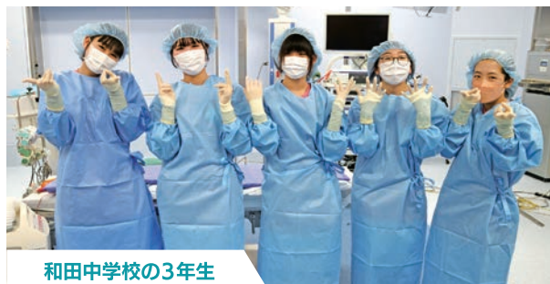
和田中学校の3年生

近年、新型コロナの影響で受け入れが出来ていなかった職場体験を4年ぶりに受け入れる事ができました。多業種の業務を体験して、生徒さんからは「初めての体験や、普段なら絶対に関わる事のないような部署の見学もでき、とても勉強になった」と、感想をいただきました。今回の体験を通して、進路を選択する際の参考にいただければ幸いです。