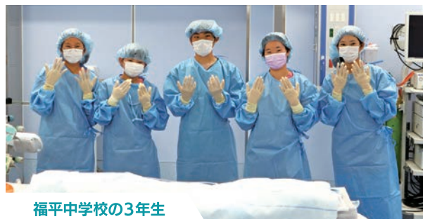
福平中学校の3年生