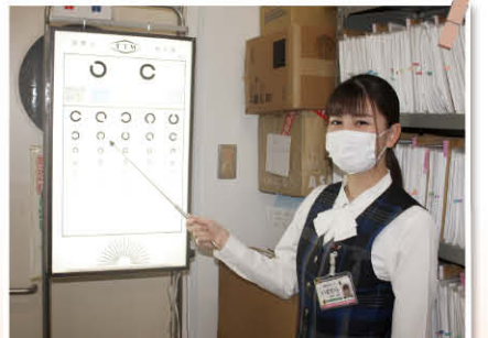
健康管理センター