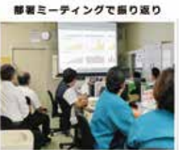
常時、部署内のモニターに表示